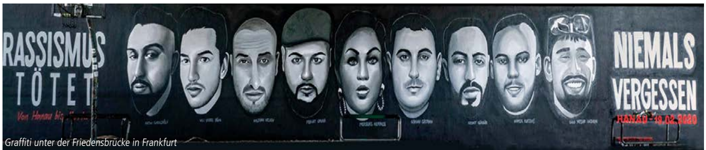
Graffiti unter der Friedensbrücke in Frankfurt