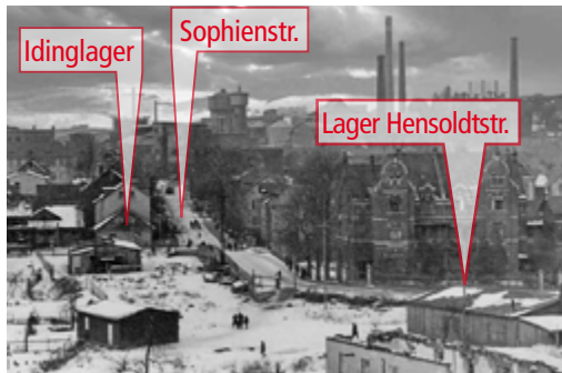
Lagererrichtung 1941 auf dem zugeschütteten Dill- und Lahnkanal

Derartige Tafeln sind seit 2018 auch für die größeren Lager der Buderusschen Eisenwerke, Pfeiffer Apparatebau und Ernst-Leitz-GmbH mit den heutigen Nachfolgefirmaen, sowie den heutigen Nutzern der Areale auf dem IKEA-Parkplatz, der Lahninsel und in der Sparkassenpassage errichtet worden.