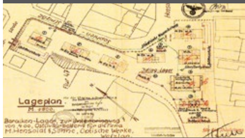
Eingereichter Bauplan